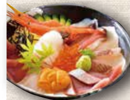
ボリューム満点 海鮮丼