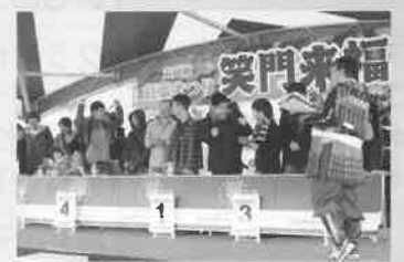
◀昨年度の「丸岡城紅葉まつり」でのクイズ大会の様子